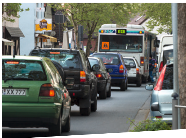
Deutscher Verkehrssicherheitsrat (DVR)